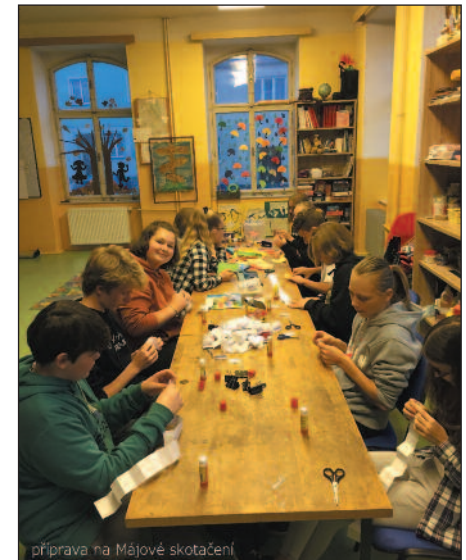
příprava na Májové skotačení