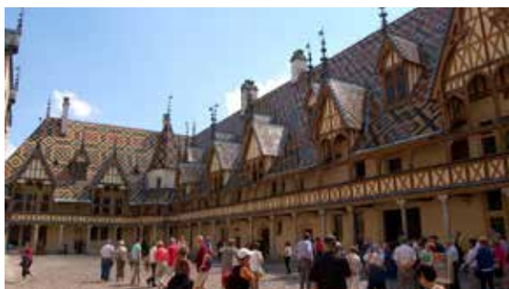
Středověký špitál v Beaune