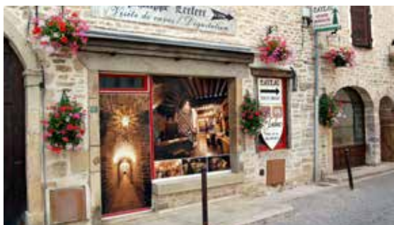
Vinné sklepy kam se podíváte