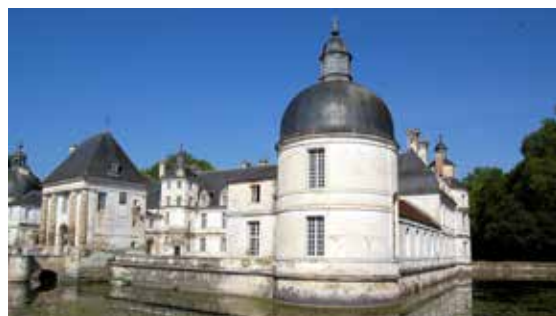
Zámek z Angeliky - Tanlay