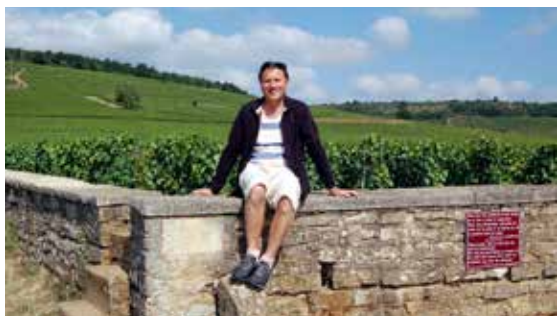
Na vinici Romanée Conti