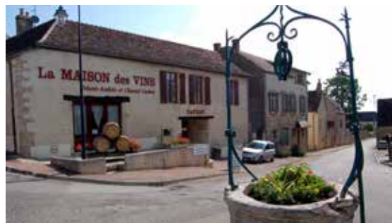
Náves vesničky Vosne Romanée