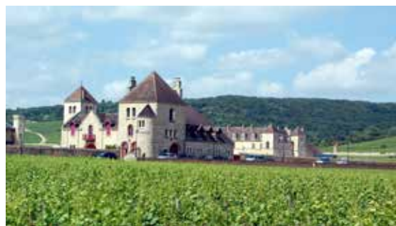
Burgundský zámek Clos de Vougeot